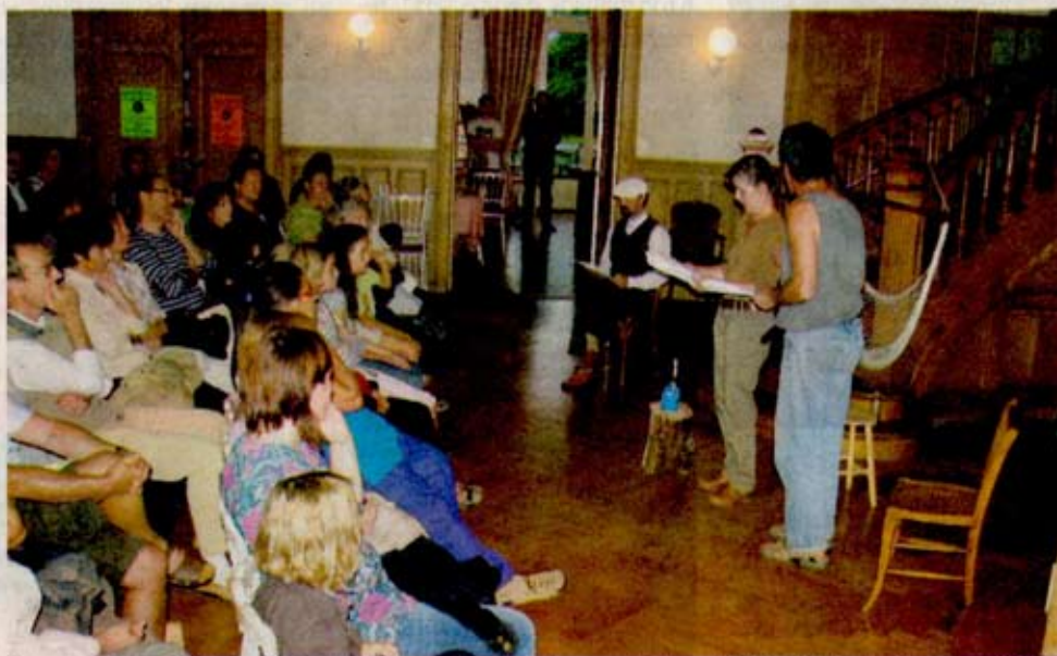
Un moment fort, "Korowai, des étoiles plein la tête", une création originale de la Cie des Gens d'Ici.